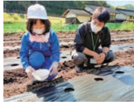
▲みんなで種を播きました

組合員やJAの職員から、種の播き方や品種特性、マルチフィルム役割などの説明を受け、約6aの畑に「ゴールドラッシュ88」を播きました。児童は、「畑に手で穴をあけ種を