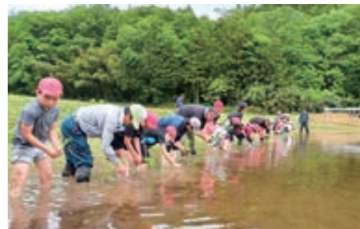
▲田植えをする児童

JA青壮年連盟の甲奴郡支部は5月30日、府中市立上下北小学校の5年生17人と田植えをしました。米作りを通して、農業の魅力や食べ物の大切さを知ってもらおう「お米づくり学習会」は、20年以上続く伝統行事です。部員が品種特性や目印のロープの使い方、植え方などを説明し、児童は約8aに「コシヒカリ」の苗を植えました。頑張った児童に「よく植えたで賞」「泥んこ賞」などの賞と記念品を贈りました。9月には、鎌で稲刈りをする予定です。