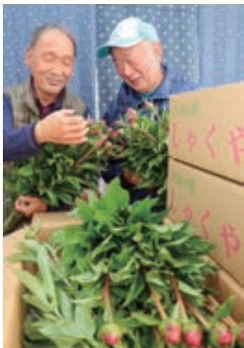
▲協力して出荷作業

れ、草丈、つぼみの大きさは例年通り良好な仕上がりとなりました。集荷場では、部員が協力して検品などの作業を行いました。出荷は5月下旬まで続き、昨年の1.4倍の約14,000本を出荷しました。