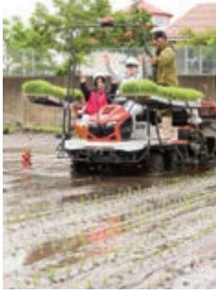
▲田植え機を体験する生徒

で、より実践的な授業を展開。5月19日には、生物生産学科2年生17人が全地球衛星測位システム（GNSS）機能が付いた田植え機を体験しました。田植え機は、水田2カ所約27aで実演。直